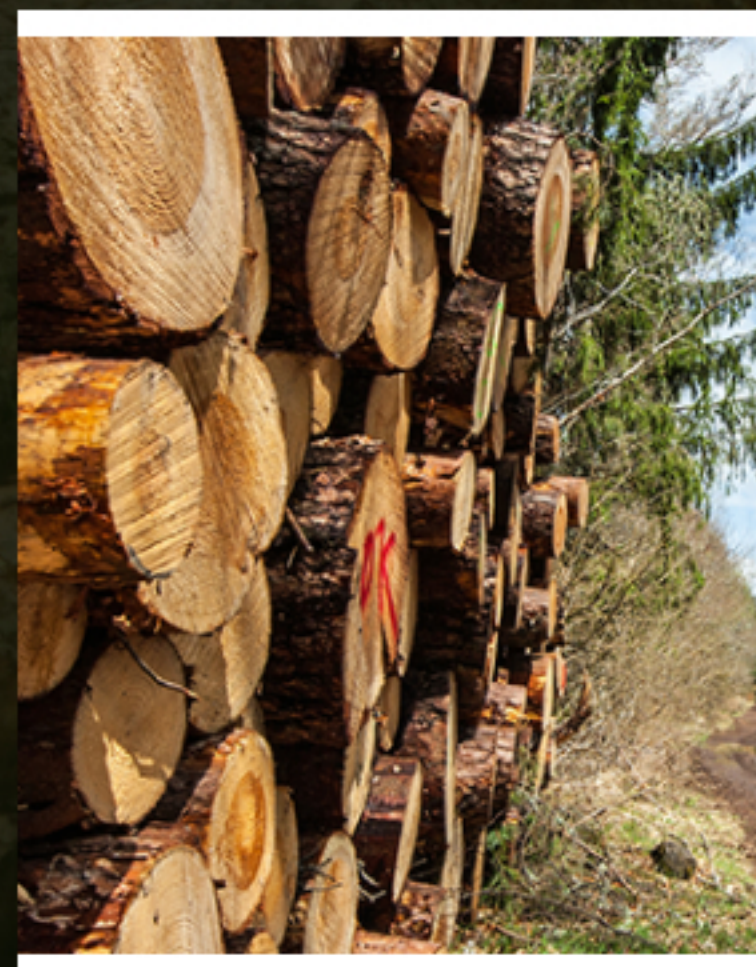
Bois de chauffage