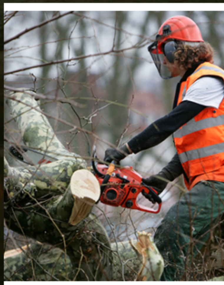
Abattage & Elagage

Si vous souhaitez bénéficier de nos compétences en sylviculture et aménagement pour parc et jardin, nous nous déplaçons à Thuin, Mons et La Louvière, mais également à Charleroi, Namur, dans le Brabant wallon et dans tout le Hainaut. Posez-nous vos questions par téléphone ou en remplissant le formulaire mis à votre disposition sur le site.